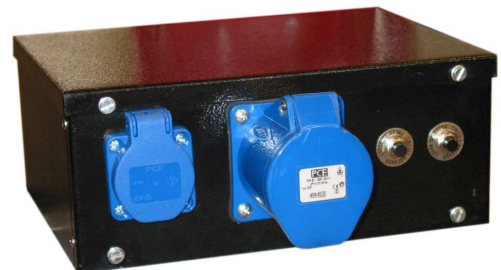
SAATAVANA MYÖS, 32 A 3p CEE-PISTORASIALLA, JOLLOIN KOKO TEHO SAADAAN YHDESTÄ RASIASTA. (TARVITAAN ESIM. KIINTEÄÄN ASENNUKSEEN.) TEHDASTOIMITUKSESSA VELOITUKSETTA. TILAUS TYYPPI: 6501 DY-PR32