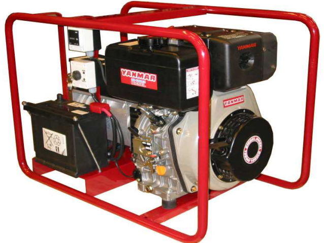
KUVIEN KÄYTTÖTUNTIKASIN ON LISÄVARUSTE