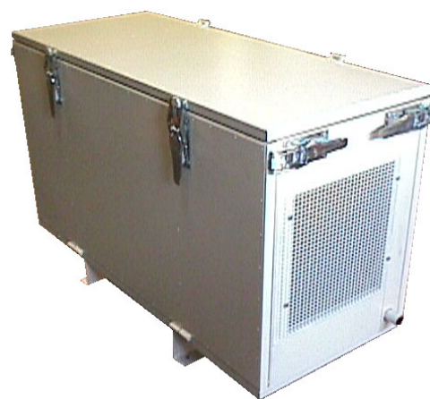
Sääsuoja / Äänieristys