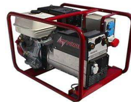
EW 220 H

Kaapelit ja muut hitsausvarusteet löytyvät lisävarustehinnastosta