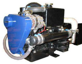
10 DMW4 Marine