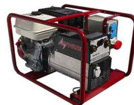
EW 220 H

Kaapelit ja muut hitsausvarusteet löytyvät lisävarustehinnastosta