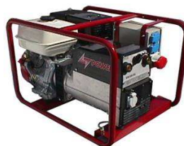
EW 220 H

Kaapelit ja muut hitsausvarusteet löytyvät lisävarustehinnastosta